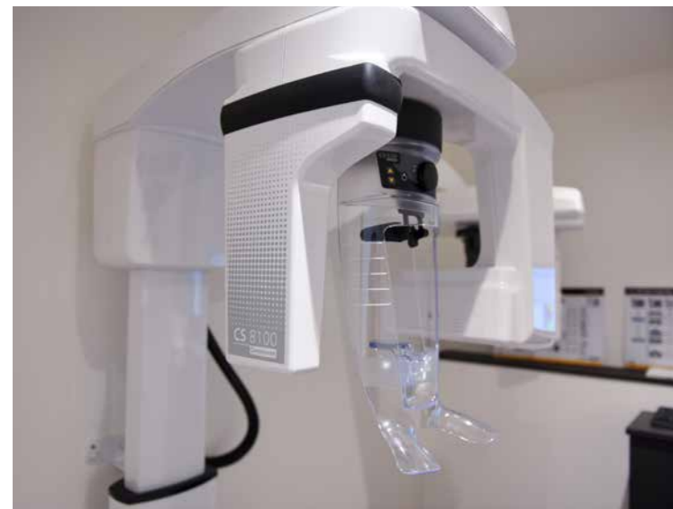
Une radio panoramique Carestream Dental y est installée, un instrument de précision indispensable et rapide pour établir des diagnostics précis.